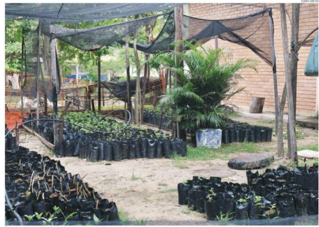
Vista de uma árvore preparada para plantio em período preventivo.